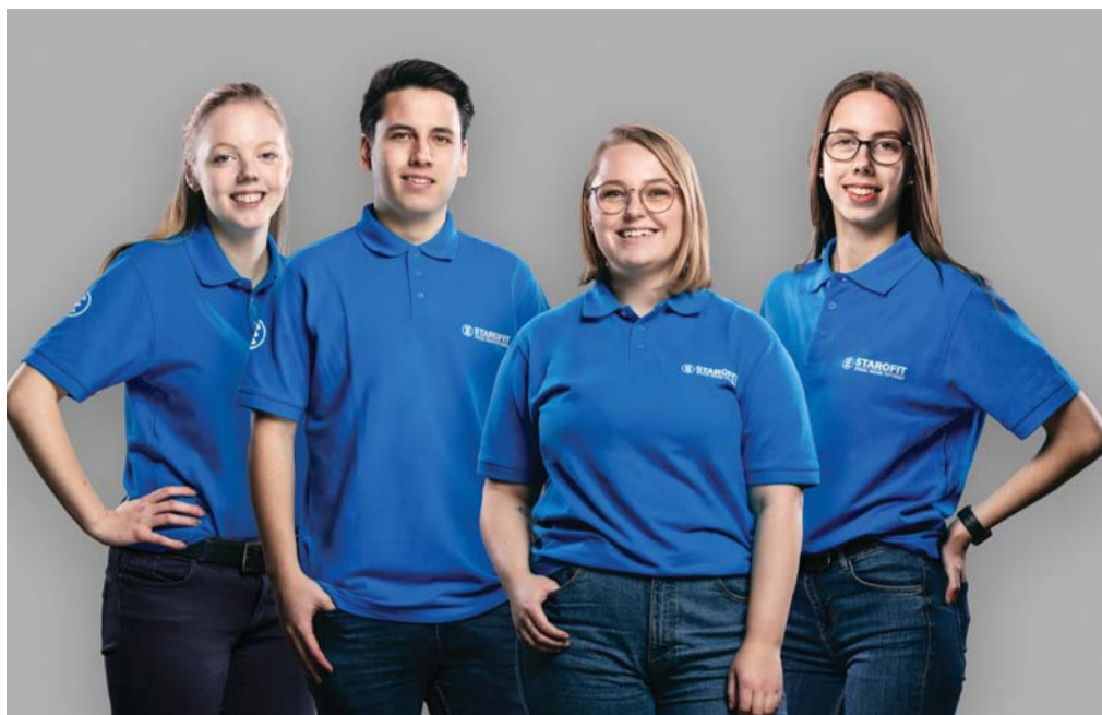
TOP-AUSBILDUNG bei STAROFIT in fünf Berufen für geballte Fachkompetenz.