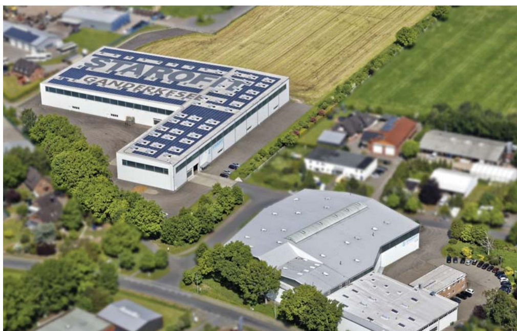
20.000 m 2 Lagerfläche in Ganderkesee mit der Möglichkeit weiter zu wachsen.